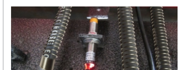
● Base approach switch