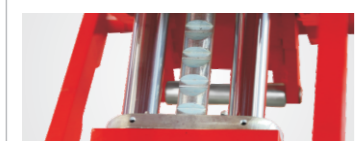
● Pneumatic release