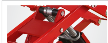
● Power paw